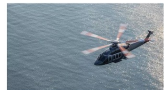
Ti av modellen Bell 525 er blant helikoptrene Equinor har skaffet seg.

Gjennom avtaler med helikopterprodusentene Bell og Leonardo, sikrer Equinor 15 nye helikoptre til passasjertrafikk på norsk sokkel. Luftfartstilsynet sier de ikke har noen motforestillinger.