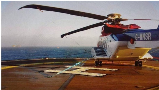
DELEMANGEL: Over helle verda står no Sikorsky S92 på bakken på grunn av delemangel.

Kritisk mangel på delar som inneheld metallisk titan kan lamme helikoptertrafikken i Nordsjøen. Det er førebels ikkje klart kva som då vert alternativet.