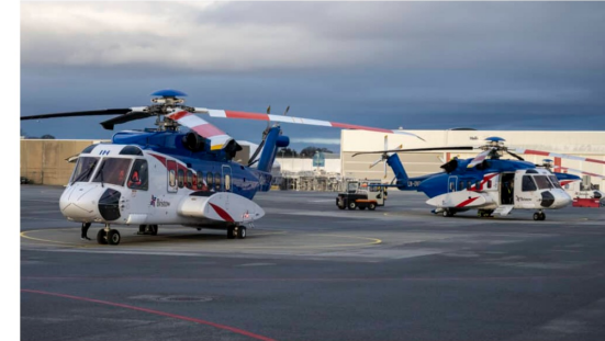
Fleire Sikorsky S-92 maskiner kan bli satt på bakken framover på grunn av delemangel. Her på Stavanger lufthavn. Sola. Arkivfoto. Atle Espen Helgesen