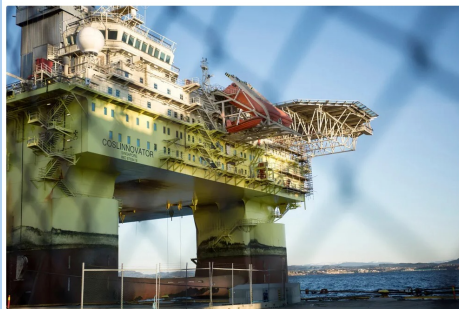
Den kinesiske riggen COSL. Innovator avviklet mens det var inne til reparasjon på Agfishes utenfor Bergen etter en dødsulykke i 2020 som var forårsaket av ledge som traff togdrifmodulen der ettersatt skal.

Regjeringen må orientere Stortinget om alle sikkerhetsvurderinger som er gjort rundt Equinors omstridte avtaler med det statseide kinesiske selskapet Cosl.