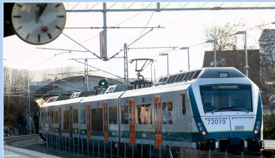
SORTTOGET: Åpning av Sorttoget i desember 2019. Toget betjener strekningen Stavanger og Egersund, og drives av Go-Ahead.