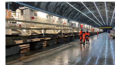
En av hallene i utbyggingen av ny vannforsyning i Oslo.

Oslo bygger ny vannforsyning. Kravene til utbyggere ble satt slik at et kinesisk selskap ikke skulle vinne anbudet, bekrefter Vann- og avløpsetaten.