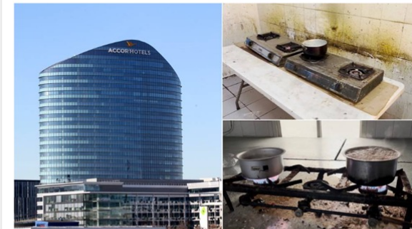
QATAR: Hotellkjeden Accor skal ha brukt underleverandører der de ansatte levde under kritikkverdige forhold. På bildet ser vi selskapets hovedkvarter i Frankrike, samt noe av dokumentasjonen fra Qatar.

Det kommer frem i en fersk rapport. DNB sier de har solgt seg ut av samme selskap fordi de frykter brudd på menneskerettighetene.