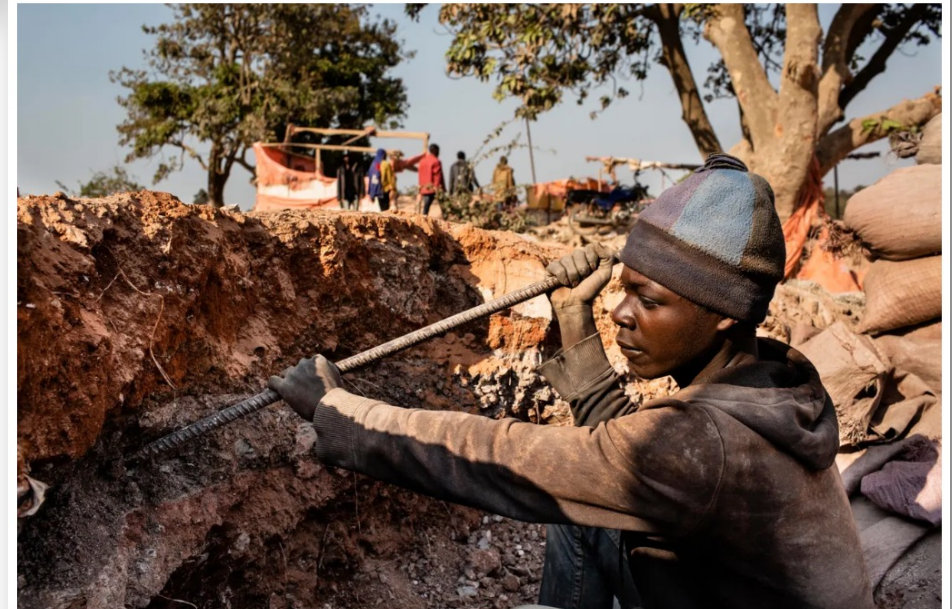
Digging for cobalt in the Democratic Republic of the Congo, where 60% of the world's supply is found. Miners often breathe in cobalt-laden dust, which can prove fatal.